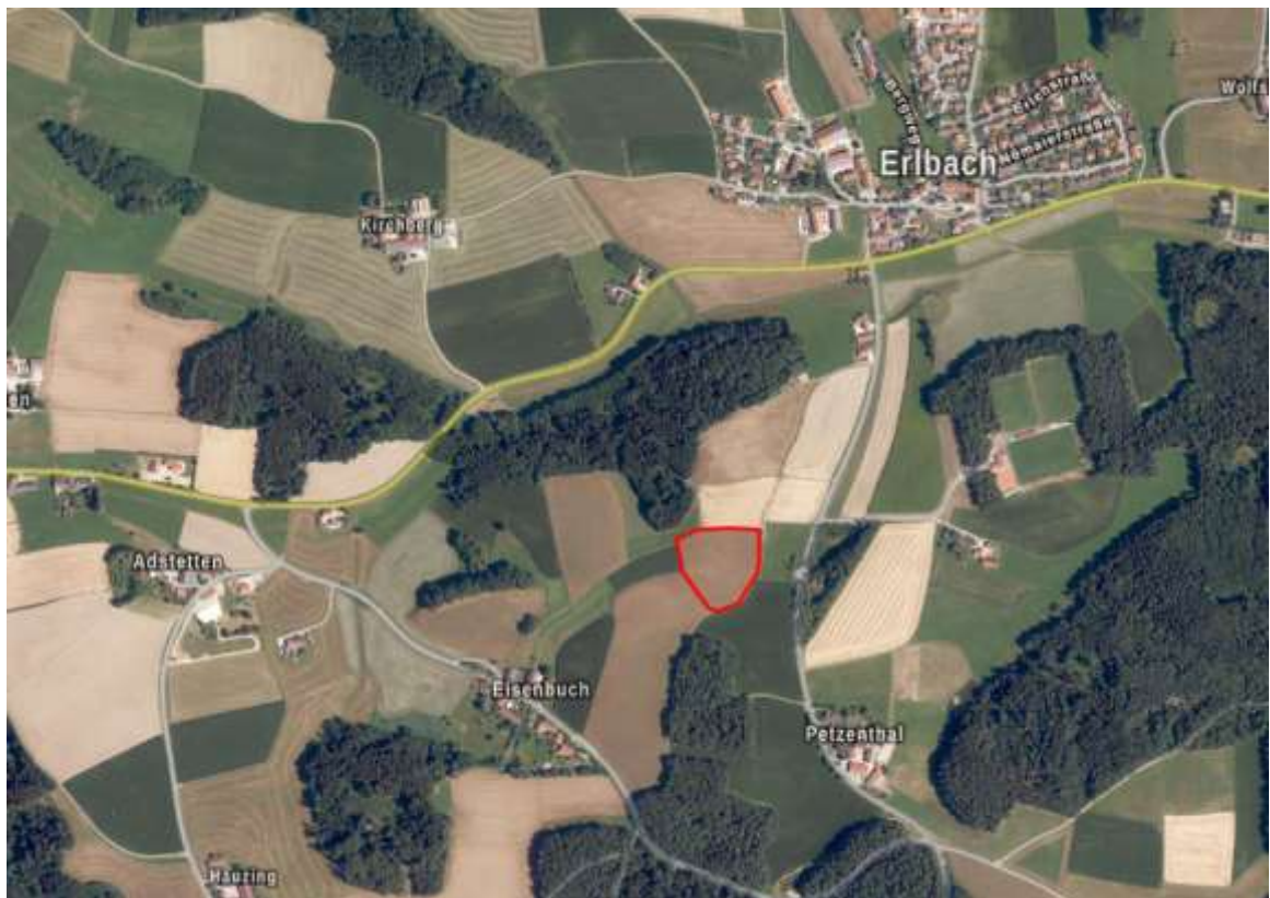
Abbildung 1 Ausschnitt Luftbild. Rot: Geltungsbereiche (grob). Ohne Maßstab.

Das Bearbeitungsgebiet liegt im Landkreis Altötting, im Osten der Gemeinde Erlbach. Die genaue Lage ist nachfolgender Abbildung zu entnehmen.